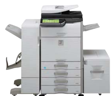
Unidad base Mesa con 3 cajones para 500 hojas de papel Finalizador encuadernador-grapador + Unidad paso de papel Bandeja de salida Bandeja de gran capacidad