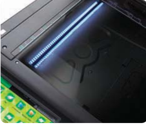
Lámparas LED de bajo consumo