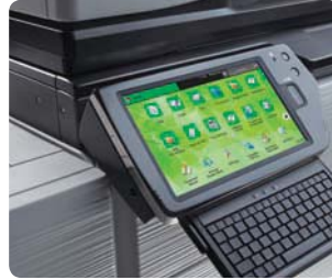
Panel abatible con teclado retráctil opcional