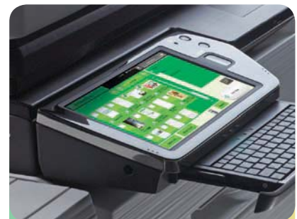
Almacenamiento y recuperación de documentos con vistas de miniaturas