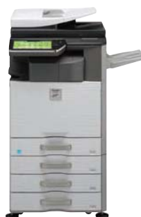
Unidad base Finalizador Mesa con 3 cajones para 500 hojas de papel Bandeja de salida