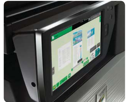
Panel de control finger-swipe inclinable para previsualizar y editar páginas con facilidad