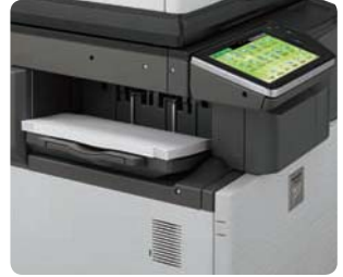
Finalizador interno opcional que ahorra espacio