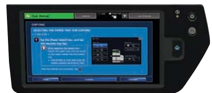
Manual de instrucciones directamente desde el panel de la impresora multifunción