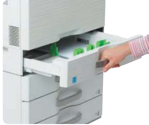
Cajones con asas de fácil agarre