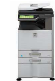
Unidad base Unidad bandeja de salida Mesa con 3 cajones para 500 hojas de papel