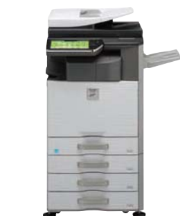
Unidad base Finalizador Mesa con 3 cajones para 500 hojas de papel Bandeja de salida